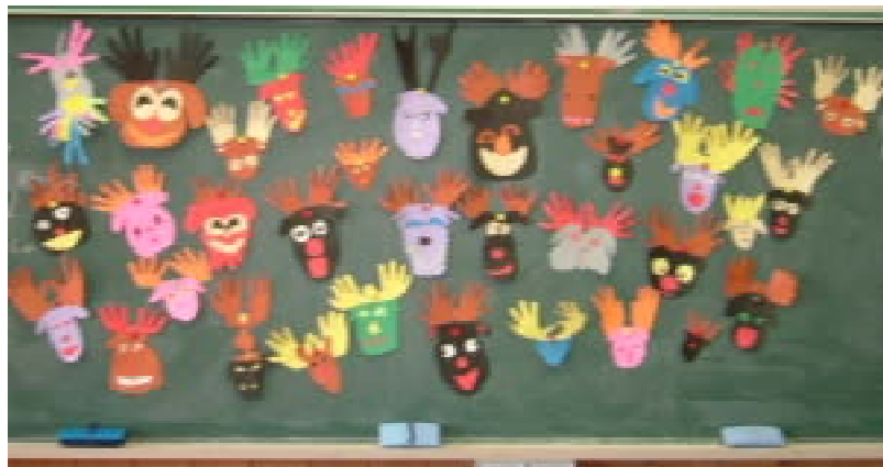
楽しいトナカイさんたち！