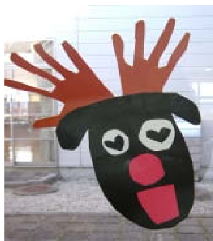
世界に ひとつだけの トナカイさん！