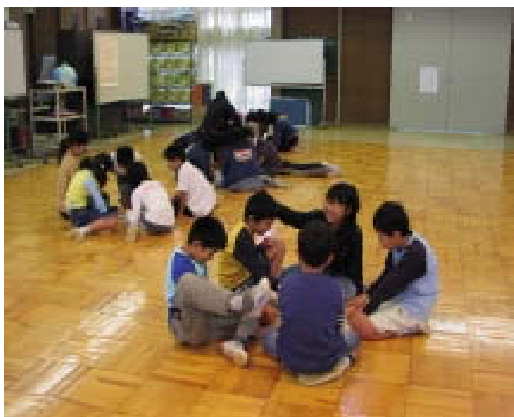
< 班の中で励まされ、楽しく英語に親しむ >