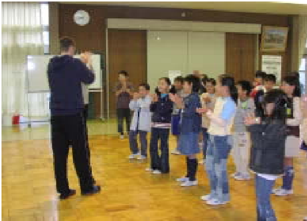
< 手拍子も交えて、楽しくウォーミングアップ >