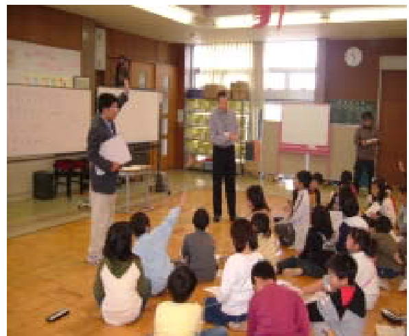
<ポイントをつけて、点数をくらべる >