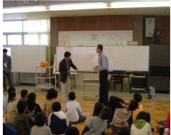
<バラバラだった言語材料を Demo を通して ゲームで使いやすいかたちにしていく >