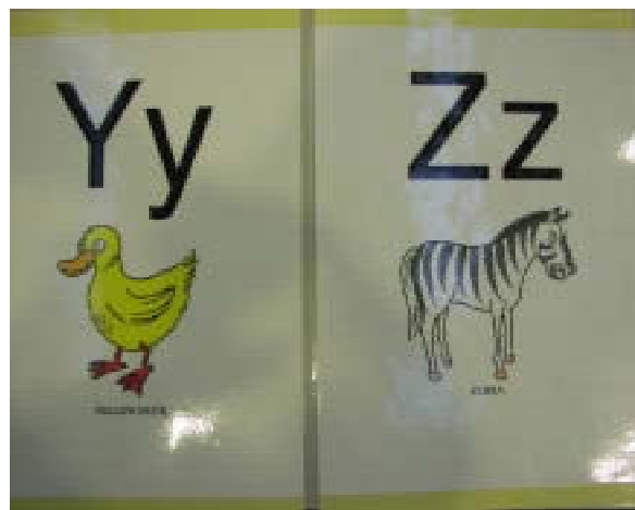
< 絵柄には言いにくい単語もある >