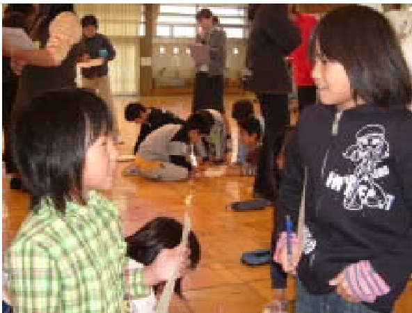
< 友だちを相手に英語を使ってみる >