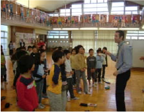
< ABC song に慣れてくると発音に気をつけて 大きな声で歌えるようになる >